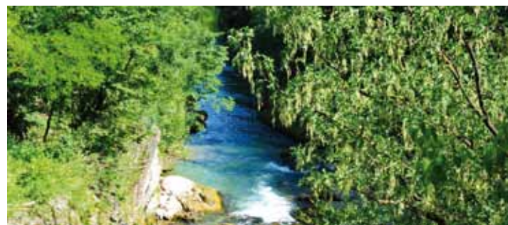
An der Erlauf

Städte, Gemeinden und Ortschaften bergen wohl gehütete, aber teilweise kaum bekannte Schätze, die auf unserem Rundgang geschildert werden: Wieselburg, Purgstall, Scheibbs, St. Anton an der Jeßnitz, Puchenstuben und Frankenfels, Gaming und Lackenhof, Lunz, Neuhaus und Zellerrain, Lilienfeld, Türnitz, Annaberg, Josefsberg und Joachimsberg sowie Mitterbach an der Landesgrenze zur Steiermark. Die einzelnen Abschnitten zugeordneten Exkurse schildern wesentliche Faktoren, die die Entwicklung der gesamten Region maßgeblich beeinflusst haben und zum Verständnis des Gebietes notwendig sind.